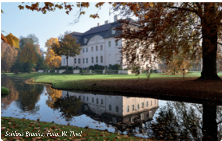
Schloss Branitz, Foto: W. Thiel