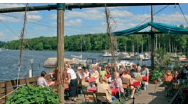
Ausflugsziel am Seddinsee

Das anschließende Karolinenhof ist ein sehr gediegener Villenvorort. Für all jene, die kein Anwesen am Wasser besitzen, lohnt das Aussteigen jedoch nicht. Hier gibt es nur wenige Zugänge zum Langen See, wie die Dahme hier heißt. Weiter geht es durch den Wald nach Schmöckwitz. Die Endhaltestelle befindet sich mitten auf dem alten Dorfanger, über dem die Kirche von 1799 thront. Wir sind im südlichsten Ortsteil von Berlin, am Ende der längsten Straße von Berlin, dem Adlergestell. Egal in welche Richtung man sich wendet: Hier ist überall Wald und Wasser. Um Schmöckwitz herum treffen sich Langer See, Seddinsee, Große Krampe und Zeuthener See.