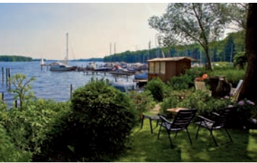
An der Großen Krampe

Das anschließende Karolinenhof ist ein sehr gediegener Villenvorort. Für all jene, die kein Anwesen am Wasser besitzen, lohnt das Aussteigen jedoch nicht. Hier gibt es nur wenige Zugänge zum Langen See, wie die Dahme hier heißt. Weiter geht es durch den Wald nach Schmöckwitz. Die Endhaltestelle befindet sich mitten auf dem alten Dorfanger, über dem die Kirche von 1799 thront. Wir sind im südlichsten Ortsteil von Berlin, am Ende der längsten Straße von Berlin, dem Adlergestell. Egal in welche Richtung man sich wendet: Hier ist überall Wald und Wasser. Um Schmöckwitz herum treffen sich Langer See, Seddinsee, Große Krampe und Zeuthener See.